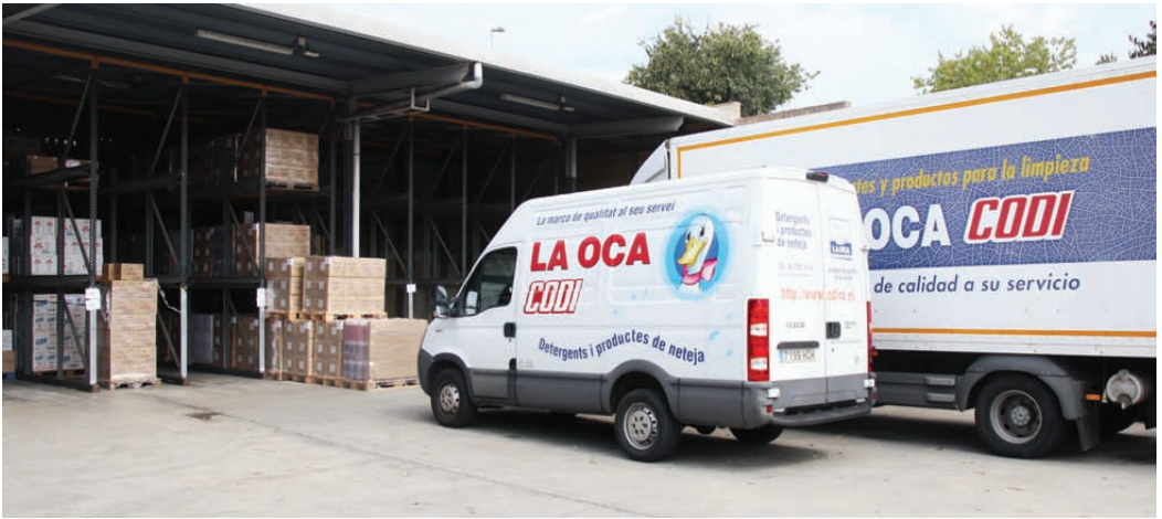
El ritme de producció La Oca la converteix en una de les empreses referents de la ciutat