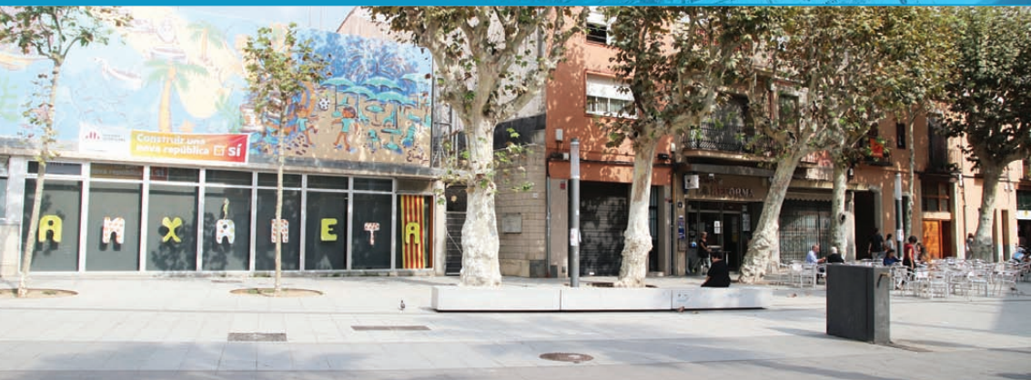
La Plaça de l'Havana, l'autèntic cor del barri